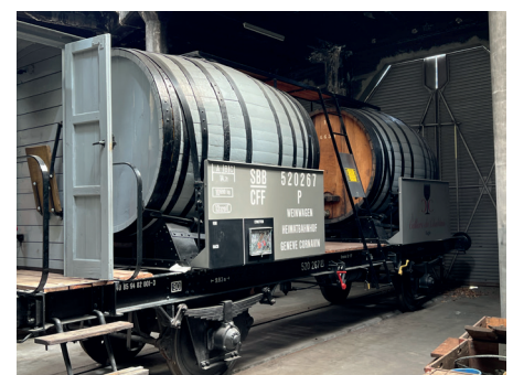
Ce wagon marchandise est dédié au transport du vin... et roule encore !