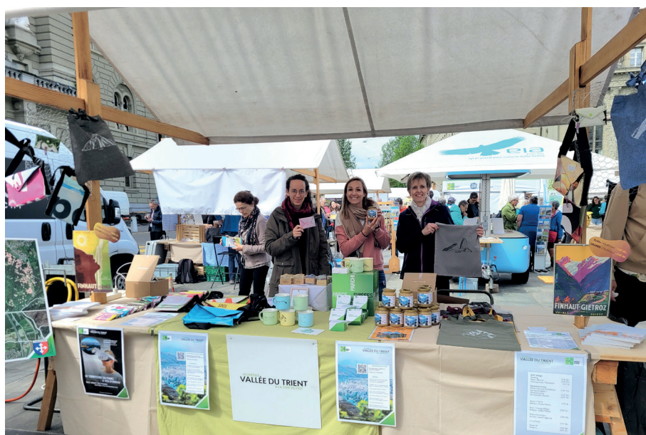
Le Parc naturel régional de la vallée du Trient s'est allié à Saint-Maurice Tourisme pour cette journée de représentation nationale.

(ESTELLE BAUR) Le 8e Marché national des parcs suisses s'est tenu sur la place fédérale de Berne le 16 mai dernier. Saint-Maurice Tourisme y a pris part pour la première fois, en accompagnant le Parc naturel régional de la vallée du Trient.