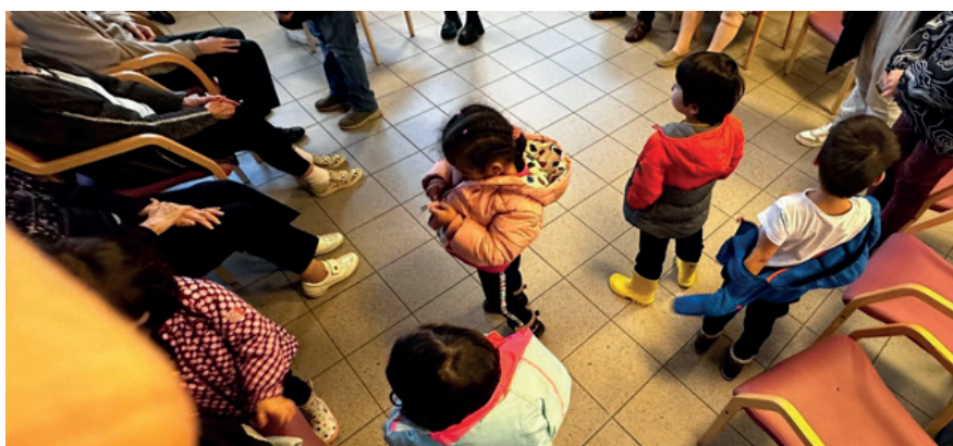
Parfois, la Dzèbe s'associe à la crèche Boule de Gomme, comme ici, lors d'une visite au foyer Saint-Jacques.

VIE LOCALE (ISABELLE FROSSARD) Constituée en association en 1994, communalisée en 2020, la Dzèbe, maison des jeunes de Saint-Maurice, est un lieu d'animation socioculturel offrant aux jeunes de la commune un espace d'accueil sécurisé favorisant les rencontres, le dialogue, l'écoute et la participation, que ce soit dans ses locaux ou dans l'espace public.