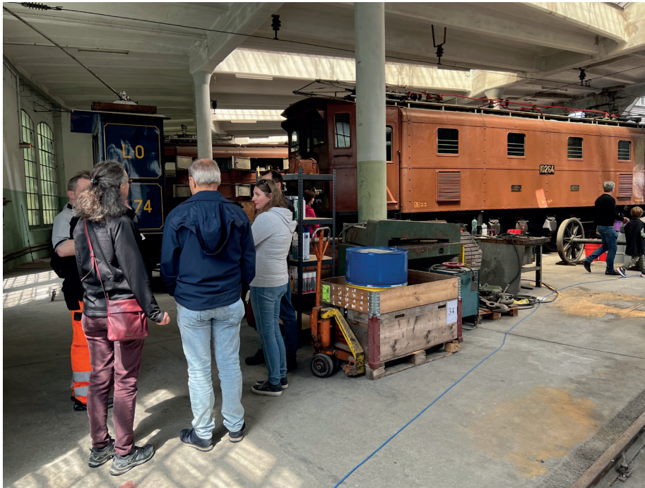
Les visites sont gratuites, mais doivent être accompagnées.

REPORTAGE BERTRAND GIRARD La rotonde de la gare abrite des reliques ferroviaires que des passionnés s'activent à ressusciter. Ils accueillent les visiteurs une fois par mois.