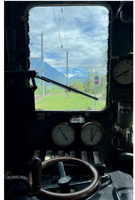
Les commandes de l'Ae 4/7. À regarder avec les yeux !

Depuis dix ans, les passionnés du Team des locomotives CFF de Lausanne retapent des reliques ferroviaires à l'intérieur de la rotonde de Saint-Maurice. Depuis peu, ils profitent de leur journée de travail mensuelle, le premier samedi du mois, pour accueillir les curieux.