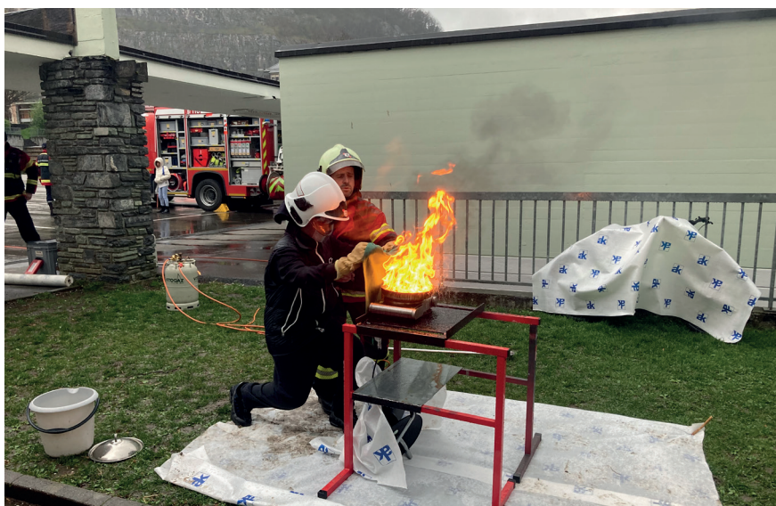
Un élève s'entraîne à l'extinction d'un feu de casserole, sous la surveillance d'un sapeur-pompier.

« Aucun élève de Saint-Maurice/Lavey ne devrait quitter l'école primaire sans notions de base de secourisme et de sauvetage ! »