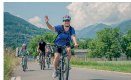
En famille, en couple ou entre amis, la Fugue est toujours une occasion festive et sportive de prendre l'air.

Avec ce nouveau tracé, disponible avant la manifestation sur notre carte interactive, tout le comité de la Fugue espère vous voir nombreux arpenter ces routes chablaisiennes et vous faire découvrir différentes activités de votre région. Pour parfaire ce jour de fête, un concours aura lieu, le tout en temps réel depuis notre site internet. En plus des activités ludiques, vous pourrez déguster de bons petits plats.