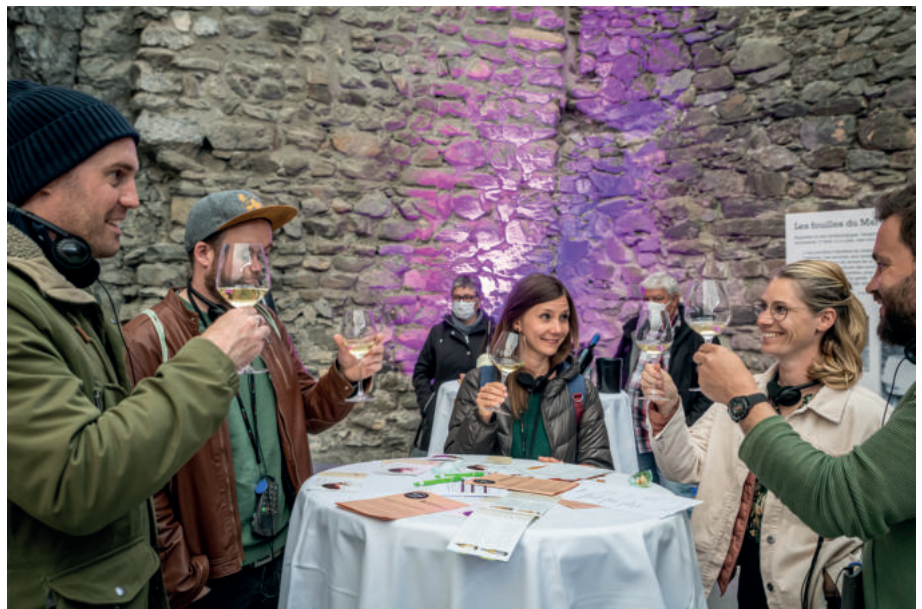
En 2021, le rendez-vous Vinum Montis avait eu lieu à l'Abbaye.

Entre vins et dessins, laissez-vous guider au cœur de la nouvelle exposition du Château autour de l'œuvre de Zep, l'auteur notamment de Titeuf, doucement accompagné par les vins de la Cave du Courset.