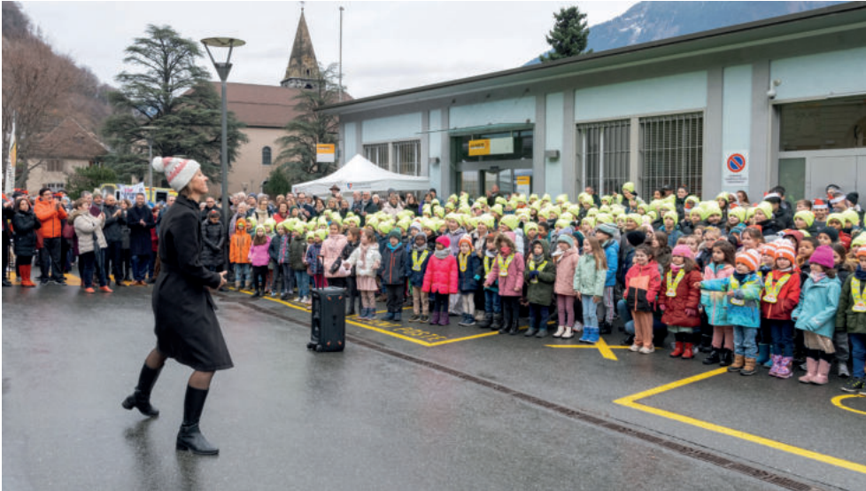
Les élèves des écoles primaires ont entonné des chants de Noël.