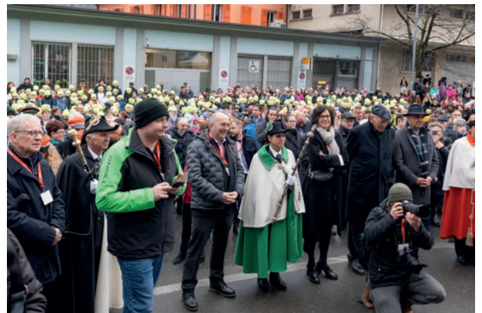
La foule s'est amassée sur la place de la gare pour suivre le discours de Viola Amherd.