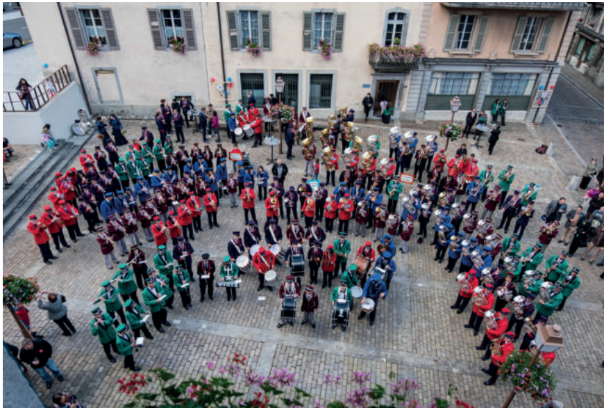
En 2017, les fanfares du district jouaient ensemble sur la place du Parvis, à l'occasion de la seconde Amicale. L'Agaunoise dévoilait alors ses nouveaux costumes.

ÉVÉNEMENT FABIEN LAFARGE La 6e édition de l'Amicale des fanfares du district de Saint-Maurice aura lieu à Saint-Maurice le 27 avril. L'Agaunoise se prépare à faire vivre toute la ville au son de la musique.