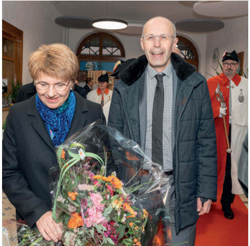
Le président de la commune a reçu la présidente de la Confédération le 21 décembre dernier.

De son pas alerte, Viola Amherd entraîna sa suite à travers l'Office vers la tribune présidentielle sous