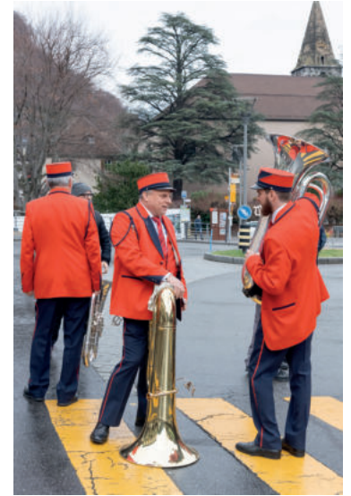
La fanfare L'Agaunoise était également présente...