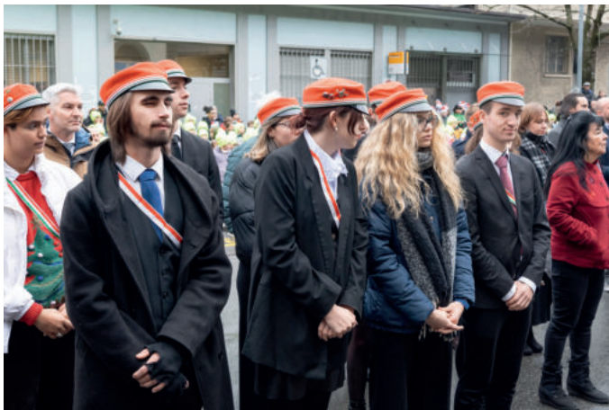
... tout comme L'Agaunia.