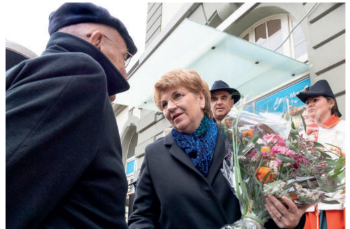
Sous le regard de son prédécesseur Alain Berset, Viola Amherd a échangé quelques mots avec un autre de ses prédécesseurs : Pascal Couchepin.