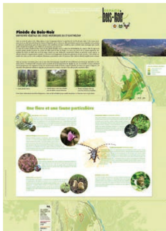
Illustration d'un panneau didactique