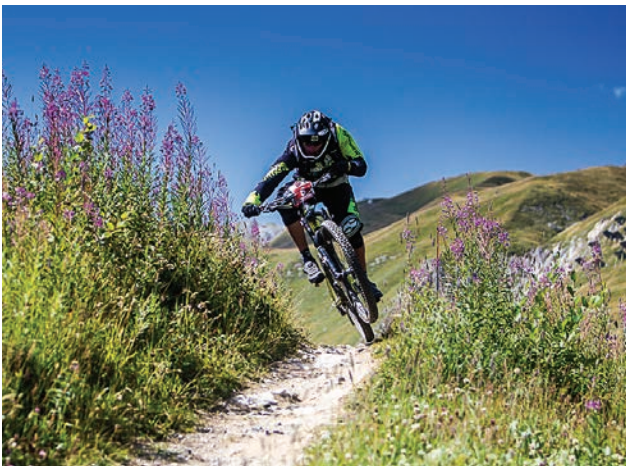
Coupe de France - Tignes

N'hésitez à pas me suivre en visitant mon site Internet : www.emmanuelallaz.ch