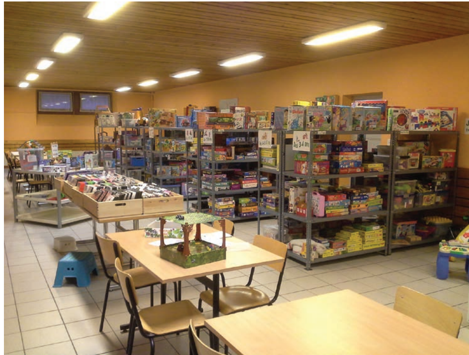
Les nouveaux locaux l'Agauludo dans les bâtiments de la Tuilerie (ancien réfectoire des élèves).

Chaque bénévole donne de son temps selon ses disponibilités personnelles et professionnelles, que ce soit deux heures hebdomadaires ou mensuelles !