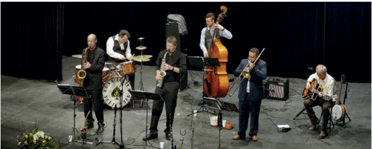
Le Cosa Nostra Jazz Band ouvrira les feux de cette série de quatre spectacles, avec une soirée « jazzalola » le samedi 22 avril.