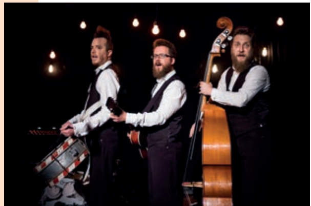
Les Petits Chanteurs à la Gueule de Bois