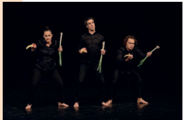
La Compagnie Zygomatic dans « Manger »