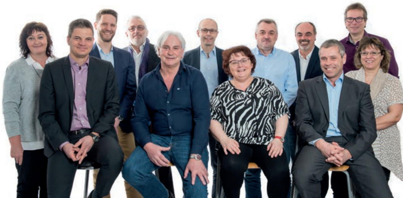
Le Conseil municipal de Saint-Maurice dans sa composition 2017-2020.