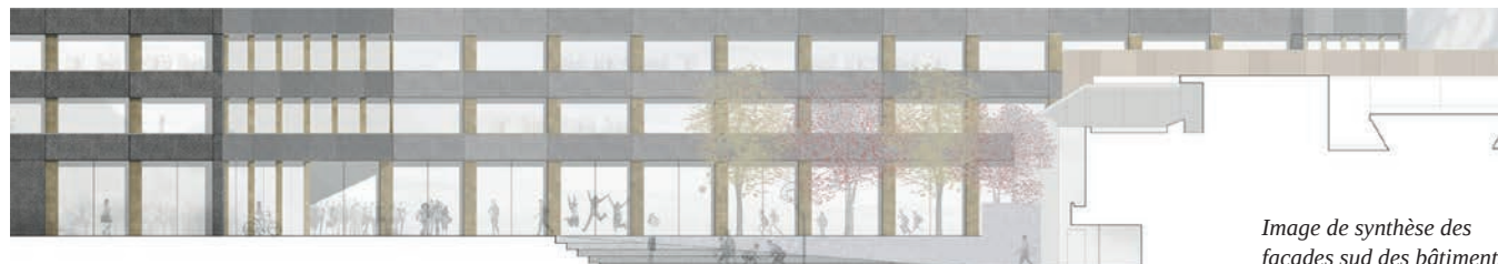
Image de synthèse des façades sud des bâtiments

Pas de panique ni de précipitation donc et prenons soin de prendre les bonnes décisions qui permettront de terminer ces bâtiments scolaires et publics, avec des finitions de qualité, tant architecturales, fonctionnelles que durables pour au moins 50 ans. Le statut de St-Maurice ville d'étude, de culture et de sport n'en sera que renforcé.