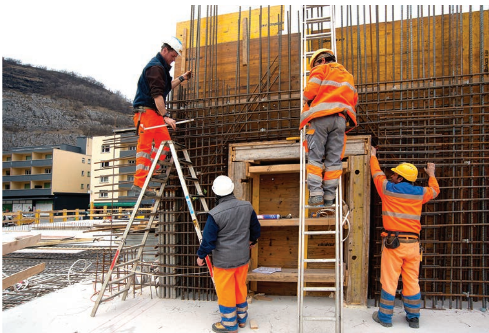
L'ouvrage en béton nécessite autant de coffrages et ferrailages ultra-modernes que de réalisations de type "artisanales".

Les surprises rencontrées sur le plan des travaux préparatoires (déménagement des services sous-terrain), de la nature du sous-sol (travaux spéciaux) et les adaptations du projet décidées par les MO ont des incidences sur le plan financier. La surchauffe sur le marché