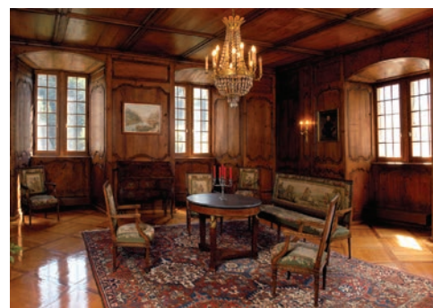
De haut en bas : La salle bourgeoise de l'Hôtel de Ville, la salle des Présidents et le salon des Gouver- neurs, au Château de St-Maurice