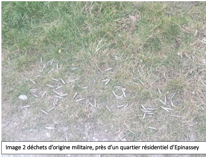
Image 2 déchets d'origine militaire, près d'un quartier résidentiel d'Epinassey

alpes. Après les exercices de tir de l'armée, il reste plusieurs sortes de déchets dans les sentiers pédestres ou ailleurs. Par cette résolution il demandait au DDPS :