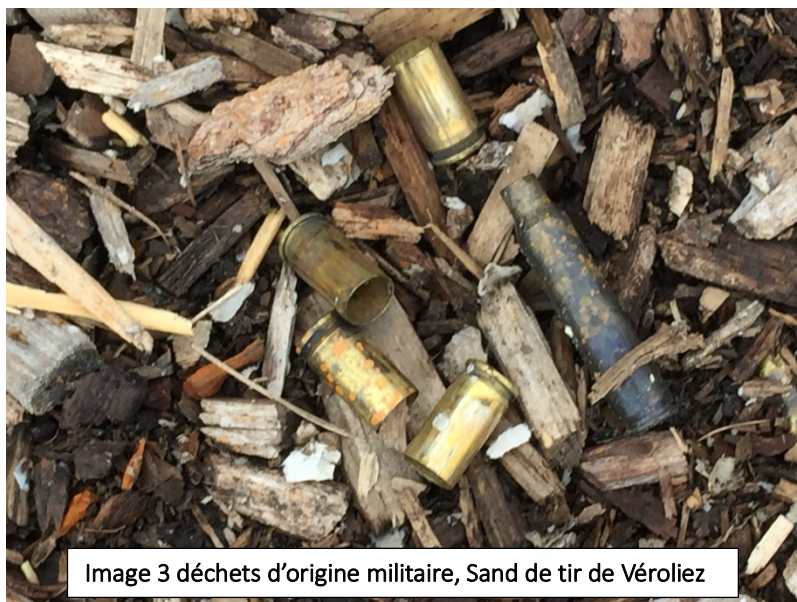
Image 3 déchets d'origine militaire, Sand de tir de Véroliez

Ainsi, ce n'est pas la première fois que le sujet est abordé tant au niveau fédéral qu'au niveau cantonal, et l'armée a déjà donné des réponses satisfaisantes sur le papier. Force est de constater que dans notre commune, en réalité et dans la pratique, « l'obligation de nettoyer les places de travail » n'est pas respectée, en tout cas pour les places mentionnées.